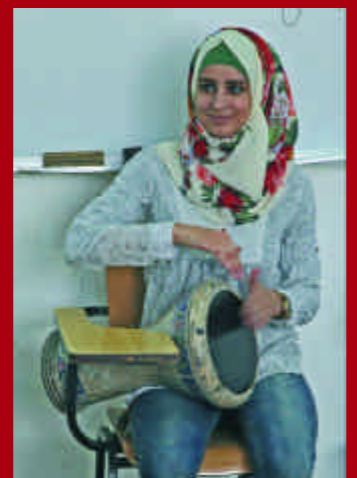
Trommelspielerin bei einem Perkussionsworkshop in Ost-Jerusalem.