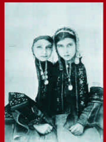
Zwei Mädchen aus Bethlehem. Aus: Walid Khalidi, Before their Diaspora, Bild 34

Wolfgang Sréter lebt und arbeitet als Autor und Fotograf in München. Er war 2008 als Menschenrechtsbeobachter für Peace Watch Switzerland in Palästina und besucht das Land seither regelmäßig.